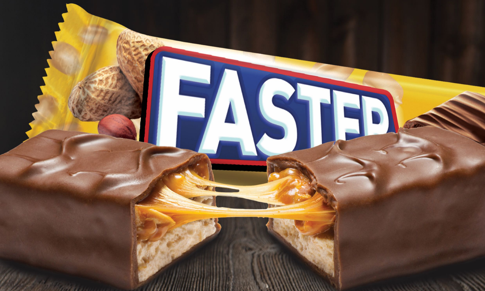
Faster Nougat فاستر نوجا