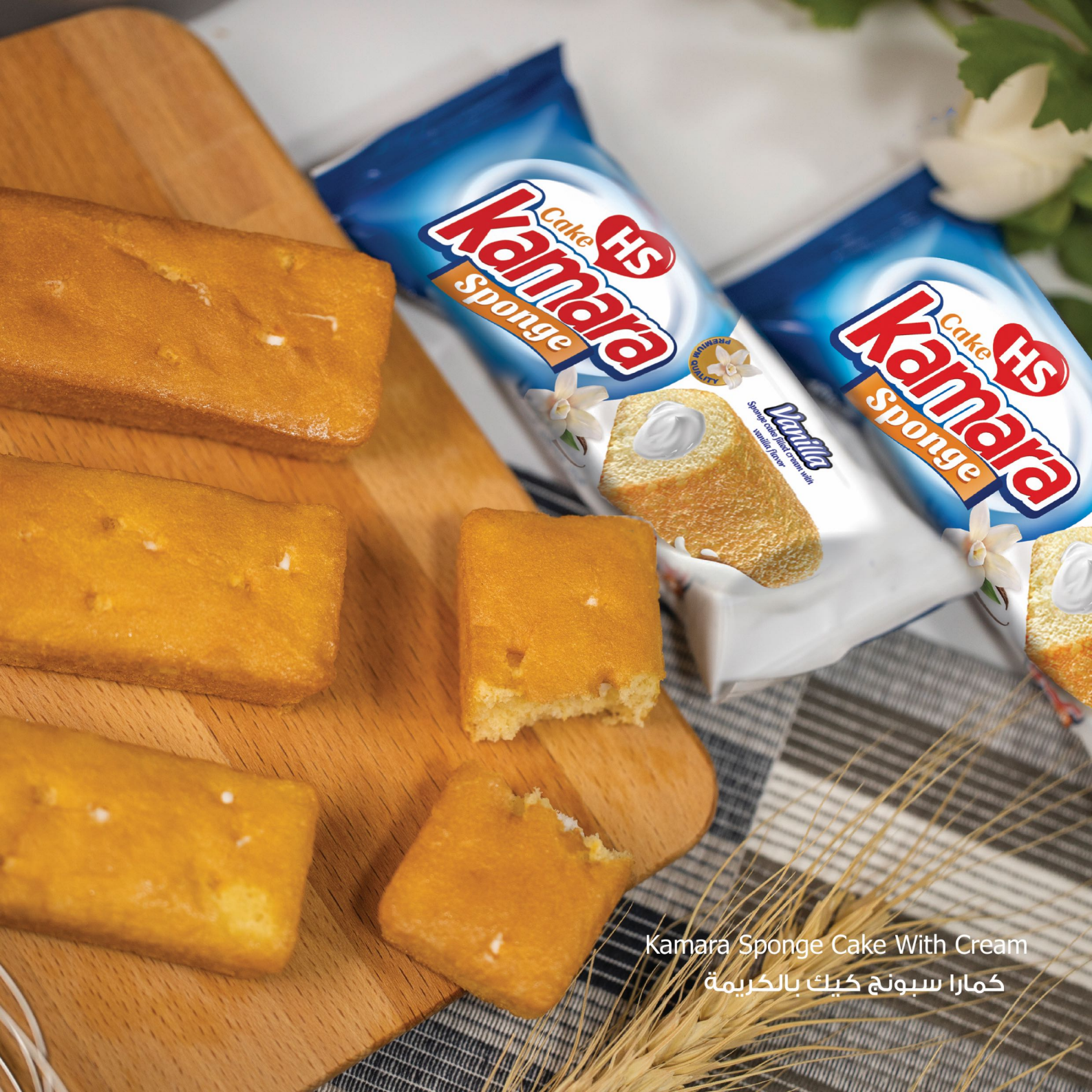
Kamara Sponge Cake With Cream كمارا سبونج كيك بالكريمة