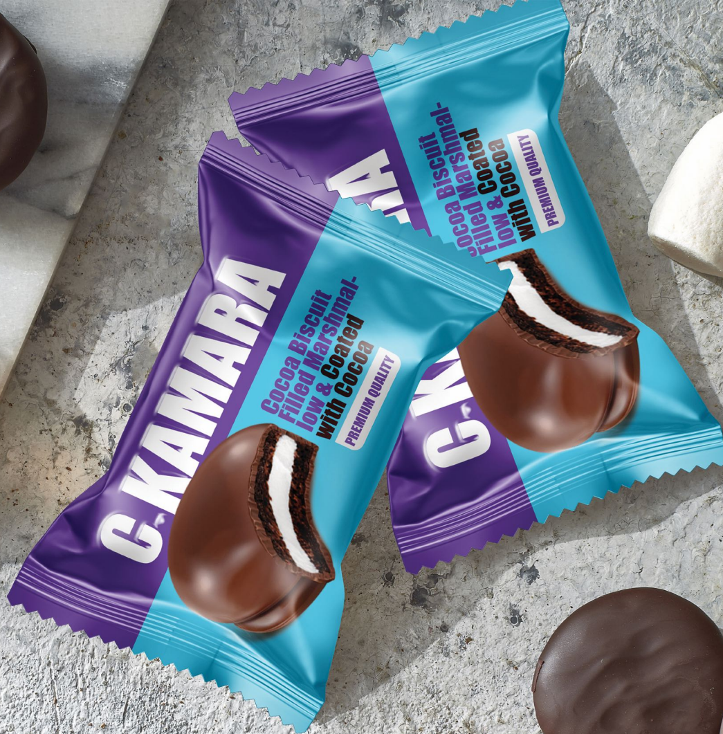
Ckamara (Biscuit With Marshmallow) سنی کمارا (بیسکویت محشوہ بالمرشملو)