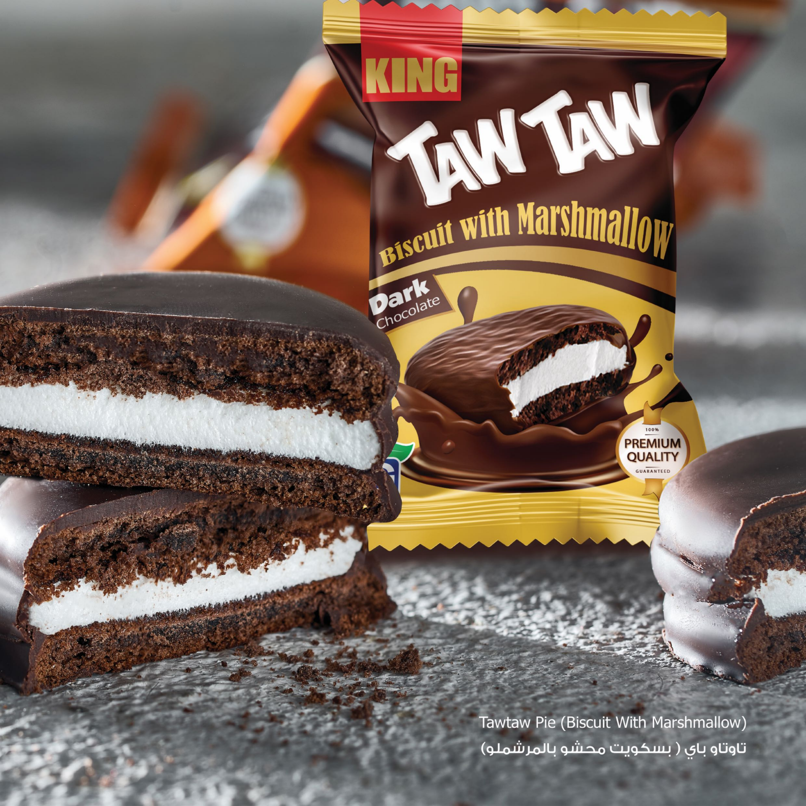
Tawtaw Pie (Biscuit With Marshmallow) تاوتاو باي ( بسكويت محشو بالمرشمولو)